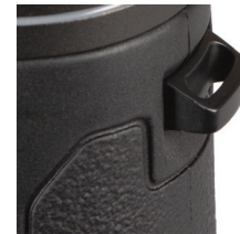
Fig. 5 Lengüeta de correa

Para poner la correa del cuello, pase los extremos de la correa por el asa de la correa ( Fig. 5 ) a cada lado de los prismáticos, luego retroceda a través de la hebilla de plástico que hay en la correa ( Fig. 6 ). Ajuste la posición de los prismáticos en su pecho mientras cuelgan de su cuello como prefiera, cambiando la longitud de la sección de correa que atraviesa el canal y la hebilla de la correa la misma cantidad en cada lado. Si prefiere usar una correa de posventa con anillos metálicos, engánchelos en una cremallera de plástico que hay en las lengüetas en vez de instalarlas directamente en ella, para evitar dañar el acabado de los prismáticos por contacto con los anillos.