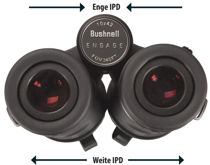
Abb. 3 Augenabstand (IPD – Interpupillary Distance) Abstandanpassung

ihn öffnen (siehe Abb. 4). Vermeiden Sie ein Überdrehen oder Forcieren des Dioptrienmechanismus. Falls es Ihnen nicht gelingt, das Objekt durch Anpassung des Dioptrienrings für Ihr rechtes Auge scharf zu stellen, überprüfen Sie, ob die linke Seite immer noch scharf ist (wiederholen Sie gegebenenfalls Schritte 2 - 4). Die Dioptrienanpassung sorgt im Grunde für den „Feinfokus“ auf einer Seite des Fernglases (nur rechts), um leichte Unterschiede in der Sehkraft Ihres linken und rechten Auges zu berücksichtigen.