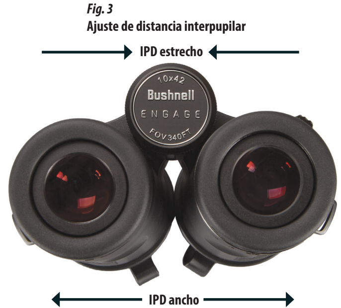
Fig. 3 Ajuste de distancia interpupilar