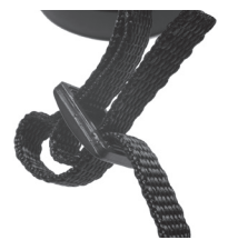
Fig. 6 Attache et boucle