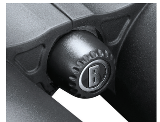
Fig. 7 Manchon de fixation du trépied avec capuchon

Toutes les surfaces extérieures des lentilles comportent notre nouveau revêtement EXO Barrier™ (outre un multi-revêtement intégral). EXO Barrier, est tout simplement la meilleure technologie de revêtement de protection des lentilles jamais développée par Bushnell. Ajouté à la fin du processus de protection, EXO Barrier se lie moléculairement à la lentille et remplit les pores microscopiques dans le verre. Il en résulte une protection ultra-fine qui repousse l'eau, l'huile, le brouillard, la poussière et les débris - la pluie, la neige, les traces de doigts et la saleté n'adhèrent pas. EXO Barrier est fabriqué pour durer : la protection collée ne s'atténue pas avec le passage de temps ou en raison de l'usure normale.