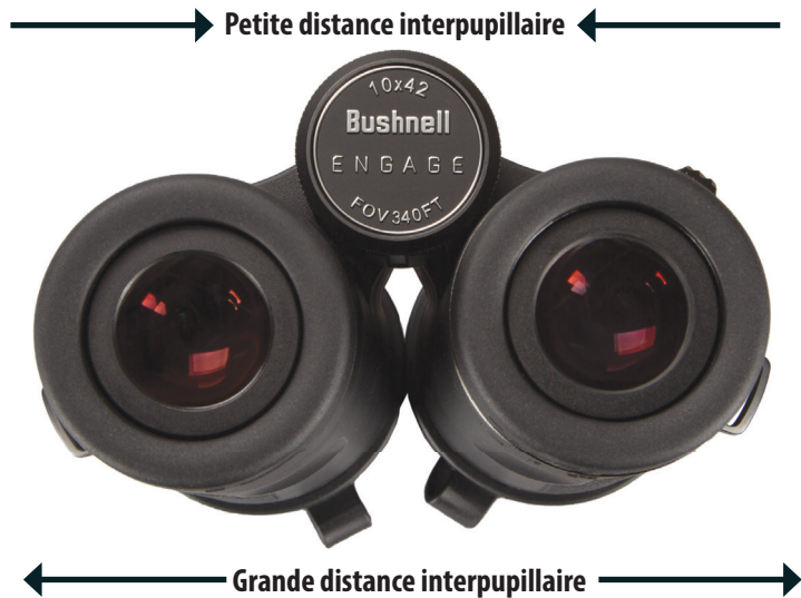
Fig. 3 Inter-pupillaire Ajustement de la distance

pas à régler la bague de dioptrie afin de mettre l'objet au point pour votre œil droit, assurez-vous que le côté gauche est toujours mis au point (recommencez les étapes 2 à 4 si nécessaire). Le réglage de la dioptrie offre essentiellement une « mise au point précise » d'un côté des jumelles (droit uniquement) pour permettre de légères différences de vision entre votre œil droit et votre œil gauche.