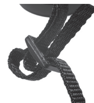
Fig. 6 Cinghia e fibbia