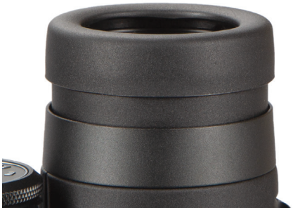
Abb. 2 Augenmuschel in der "oben"-Position (für die Verwendung ohne Brille)