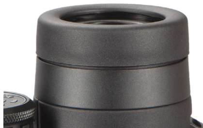
Fig. 1 Conchiglia oculare in posizione "abbassata" (per l'uso con occhiali)