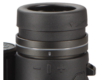
Fig. 4 Bague de réglage de la dioptrie (modèle BEN1042, déverrouillé)