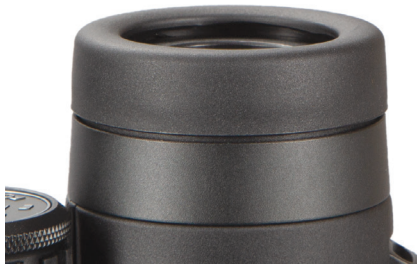
Abb. 1 Augenmuschel in der "unten"-Position (für die Verwendung mit Brille)